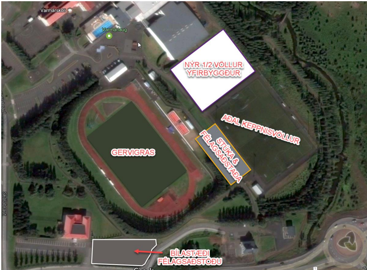
Mynd 3 Yfirlitsmynd - Tillaga Knattspyrnuæildar