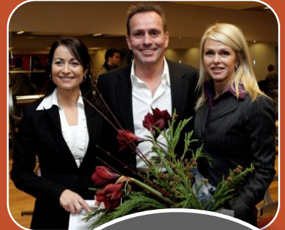
World Class og Fasteignasala Mosfellsbæjar styrkja fimleikadeildina