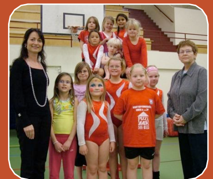
Frá undirritun styrktarsamnings við Ísfugl