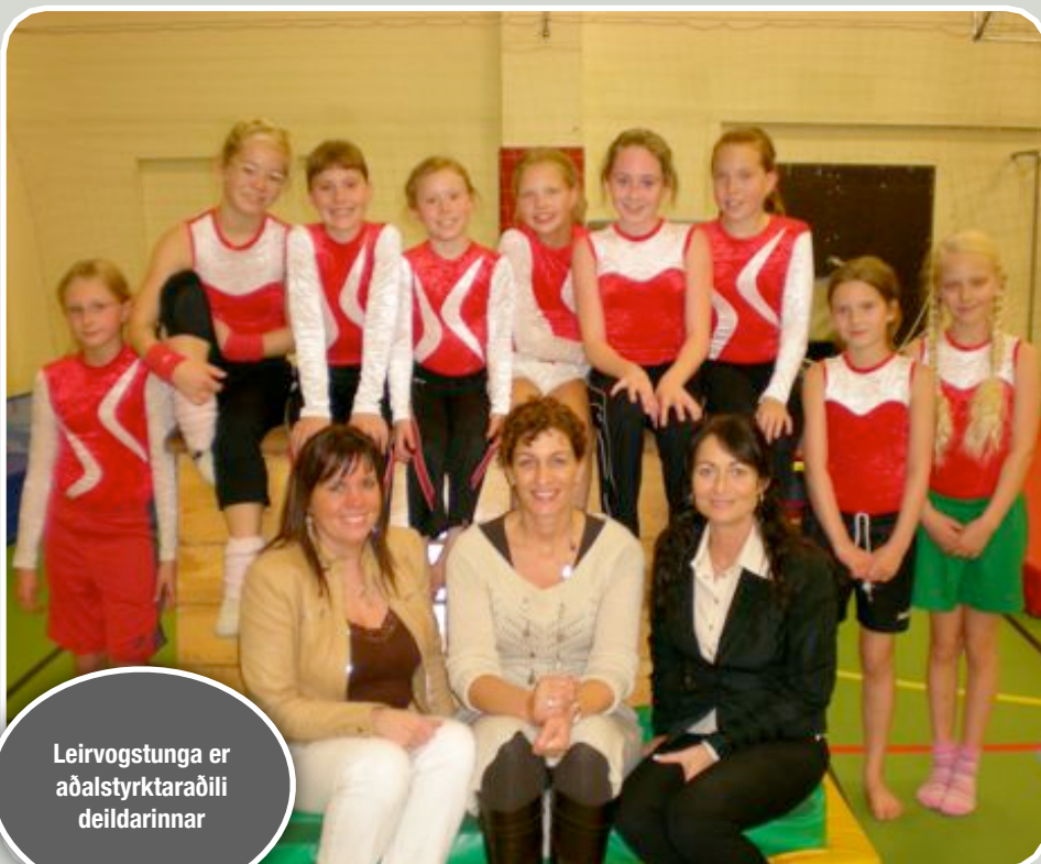
Leirvogstunga er aðalstyrktaraðili deildarinnar

Fimleikadeildin þakkar bakhjörllum sínum kærlega fyrir stuðninginn við að efla og styrkja starf deildarinnar.